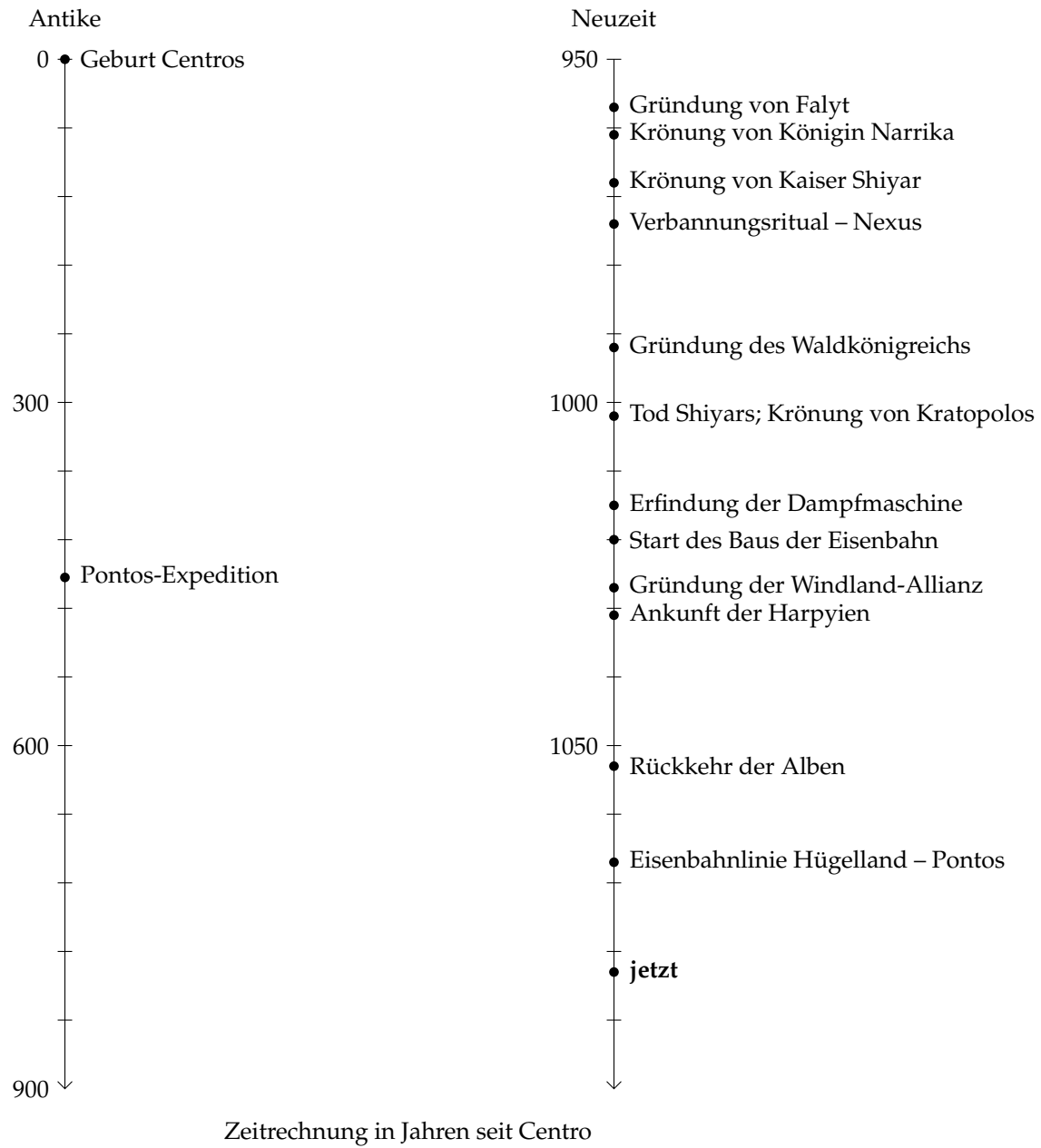
Abbildung 16.1.: Zeitstrahl der Geschichte Gaias