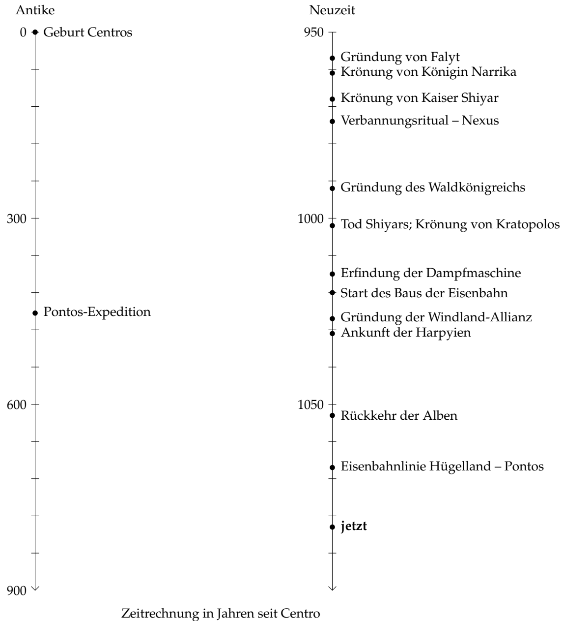
Abbildung 16.1.: Zeitstrahl der Geschichte Gaias